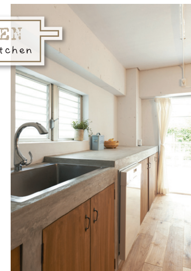
モルタルで仕上げたキッチンにはドイツ・miele社の食洗器を組み込み、デザインにこだわった

一枚の写真を見て、ときめいた。それはモルタルのキッチン。仕事から、たくさんの新築集合住宅を見てきたFさんご夫婦は、かねてから自分が住む家がありきたりではなく個性のある空間にしたい、という希望を持っていた。そんな時、モルタルのキッチンの写真を見て、「コレだ！」と決意。インターネットで検索し、アンメゾンワールドを知り、早速相談。実は、他にも相談した会社があるのだが、理想を話すと「ウチでは無理！」という返答ばかりで予算も想像以上。しかし、アンメゾンワールドは「大丈夫です。予算内に仕上げます」と心強い返事。